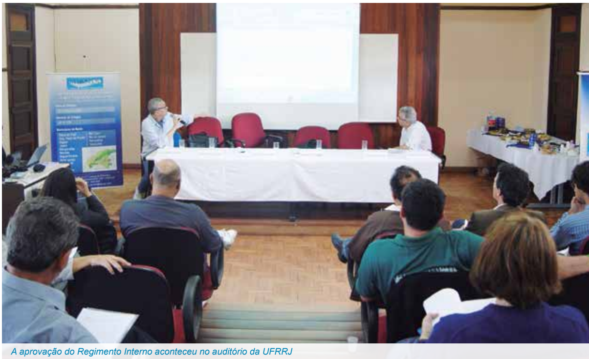
A aprovação do Regimento Interno aconteceu no auditório da UFRRJ

Os membros do Comitê Guandu aprovaram, em maio, o novo Regimento Interno durante a 4ª Reunião Extraordinária do Plenário. O documento regerá o funcionamento e as atividades a partir do biênio 2015-2016, além de trazer inovações para a gestão do Comitê.