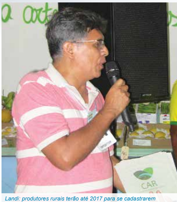
Landi: produtores rurais terão até 2017 para se cadastrarem