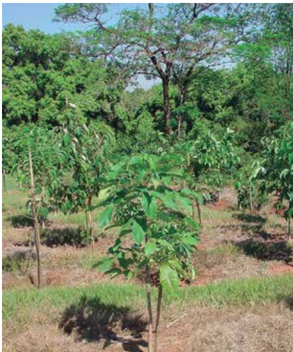
Um dos projetos do PAP é o de Recuperação de Matas Ciliares

Após aprovação, o PAP Guandu será encaminhado ao Conselho Estadual de Recursos Hídricos do Rio de Janeiro para ser validado.