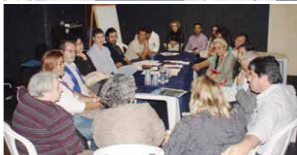
Participantes debatem demandas internas de cada segmento

Leites tornou-se a maior da América Latina a utilizar este sistema, tratando 200 litros de esgoto por segundo.